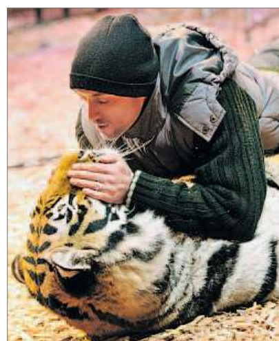
Das Verhalten von Tigern und Hauskatzen ist oft identisch, dennoch deutet der Mensch es manchmal falsch.

dass der Hund auf einmal passiv wird, keine Regung mehr zeigt: Wir nennen das ‚Einfrieren‘, und das zeugt von Anspannung, es ist ein Warnzeichen.“ Auch ein steil aufgestellter Schwanz, bei dem nur das oberste Drittel leicht wedelt, ist schon ein Zeichen der Anspannung. „Je steifer der Hund wirkt, desto angespannter ist er auch. Grundsätzlich könnte man sagen: Je mehr Bewegung im Hund ist, desto besser!“