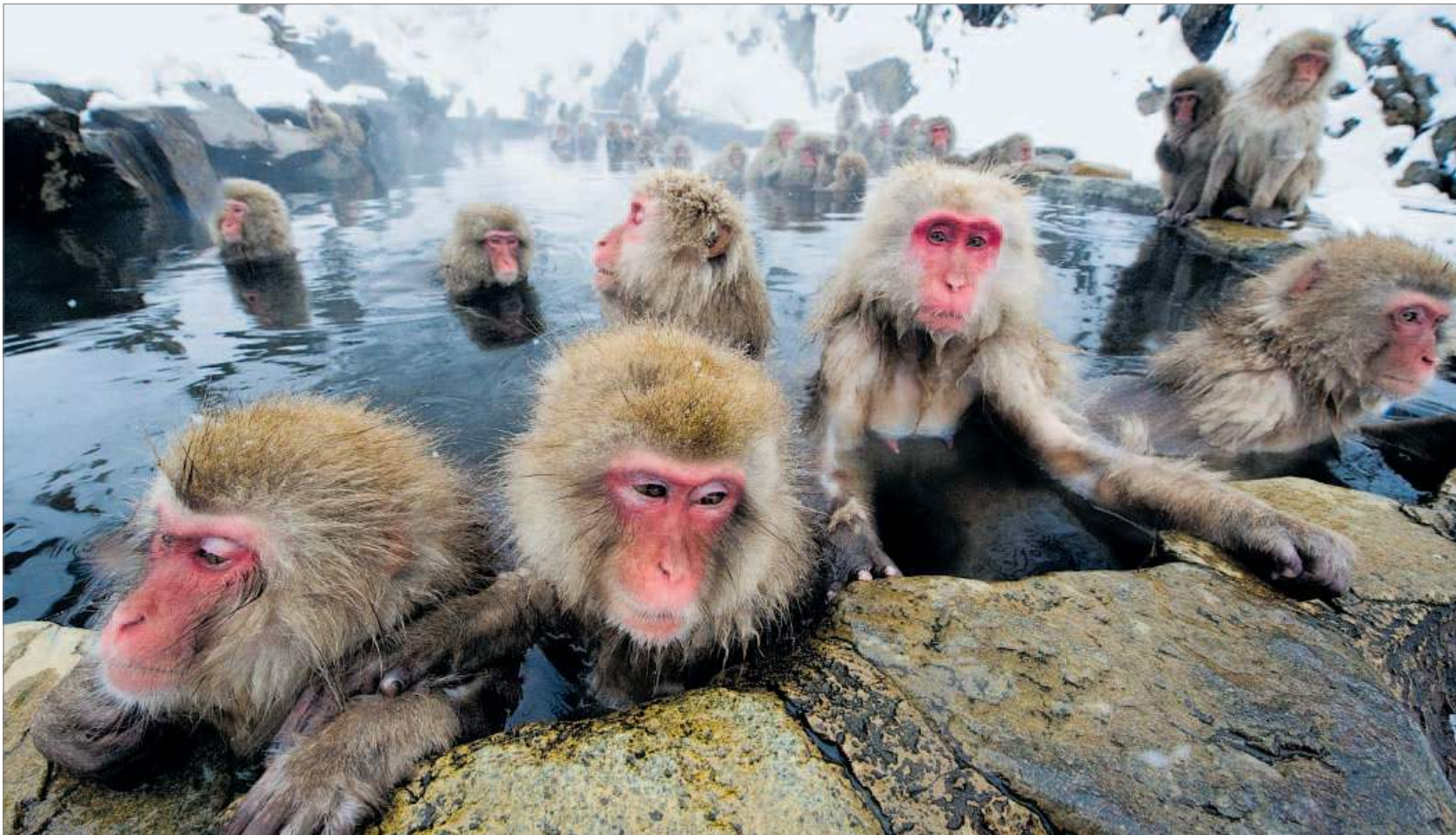
Ach, wie menschlich wirken diese japanischen Makaken beim Bad in einer heißen Quelle. Ihre Mimik und Gestik ist der unseren oft verblüffend ähnlich. Doch nicht immer wollen sie damit auch dasselbe ausdrücken.

Die neue Nürnberg plus -Serie „Die Welt der Kommunikation“ startete mit einer Folge darüber, wie sich Tiere untereinander verständigen. Heute geht es um die Kommunikation zwischen Tier und Mensch, ab der nächsten Folge steht dann der homo sapiens allein im Mittelpunkt.